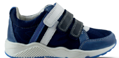
TWINS & TRACKSTYLE NO SIZE FITS ALL Kleefband 26-37 Blauw combi

Sportief en stoer. Zó willen kinderen dat hun schoenen eruitzien. Als ouder wilt u ze vooral stevig en met een goede pasvorm. Want uw kanjers vragen nogal wat van hun schoenen. Dat speelt, rent, ravot en banjert door het leven en dan zijn zaken als stevige zolen, soepele afwikkeling en draagcomfort van het grootste belang. Onze merken Piedro en Twins & Trackstyle weten dit treffend te combineren. Leren sneakers en gympen geven goede steun aan de hielen en voelen toch lekker soepel en licht aan de voeten. En dat is fijn in de zomer.