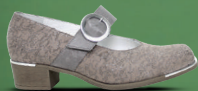
durea Bandpump 37-42 Taupe - Donkerblauw