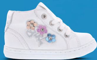
PIEDRO Booty 20-26 Wit - Wit/goud