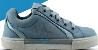
TWINS & TRACKSTYLE NO SIZE FITS ALL Veterschoen 26-32 Baby blauw