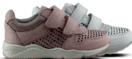
TWINS & TRACKSTYLE NO SIZE FITS ALL Kleefband 24-31 Roze - Wit