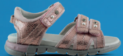
TWINS & TRACKSTYLE Roze - Wit/zilver