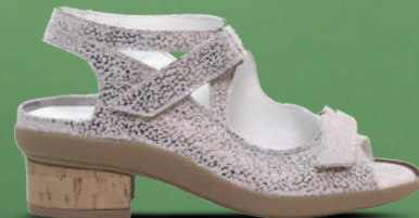
durea Sandaal 37-41 Roze met goud