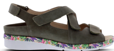
Verhulst Sandaal 37-43 Olijf groen - Taupe leopard