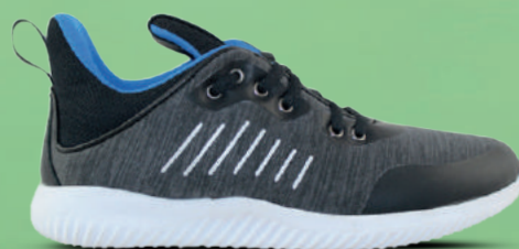
TWINS & TRACKSTYLE Sneaker 36-45 Antraciet