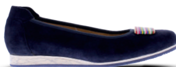
Verhulst Instapper 37-44 Donkerblauw