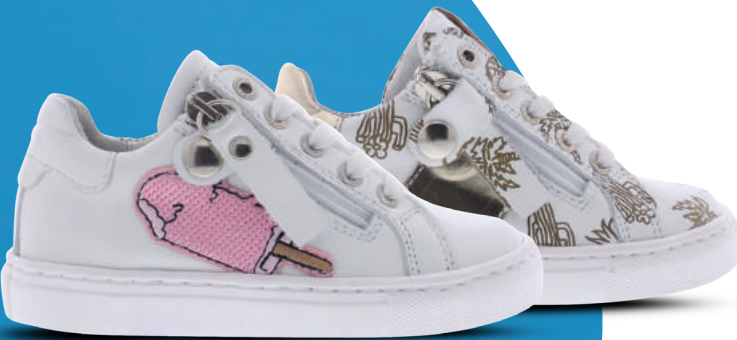
PIEDRO Veterschoen 24-35 Wit - Wit/goud