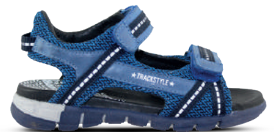
TWINS & TRACKSTYLE NO SIZE FITS ALL Sandaal 25-35 Kobalt - Zwart/oranje