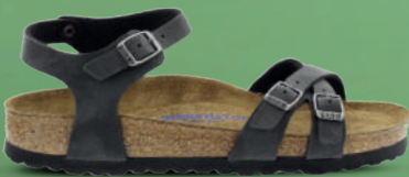
BIRKENSTOCK Sandaal 36-43 Zwart - Bruin