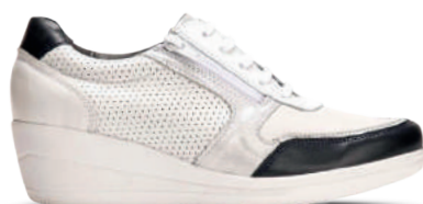
Xsensible Veterschoen 37-43 Wit - Donkerblauw