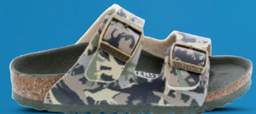
BIRKENSTOCK Slipper 26-34 Dino camouflage - Shark blue