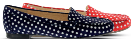
Sioux Mocassin 37-42 Blauw - Rood