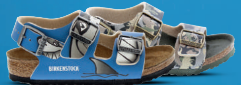
BIRKENSTOCK Sandaal 26-34 Shark blue - Dino camouflage