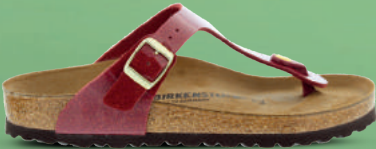
BIRKENSTOCK Slipper 35-43 Bordeaux - Wit - Taupe - Zwart