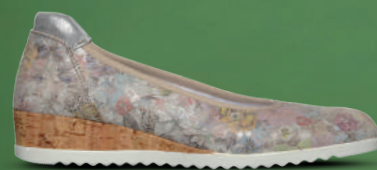
COMMON PAIRS Instapper 37-42 Multi colour - Donkerblauw