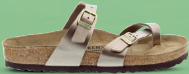
BIRKENSTOCK Slipper 36-42 Metallic taupe - Zwart lak