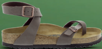
BIRKENSTOCK Sandaal 37-42 Bruin - Zwart

Het vertrouwde adres voor een zeer grote collectie BIRKENSTOCK voor dames, heren en kinderen. In meerdere breedtematen met de traditionele kurken voetbedden én met SOFT voetbedden.