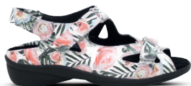
durea Sandaal 35-43 Multi - Blauw - Zwart - Wit