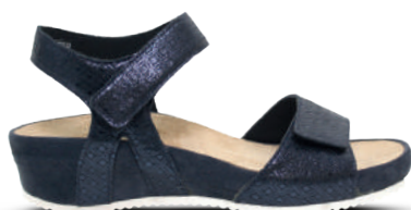
durea Sandaal 37-42 Donkerblauw