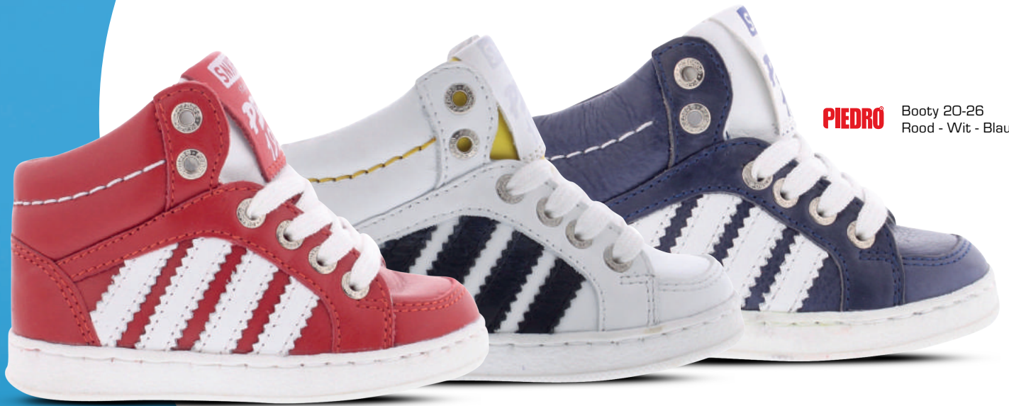
PIEDRO Booty 20-26 Rood - Wit - Blauw