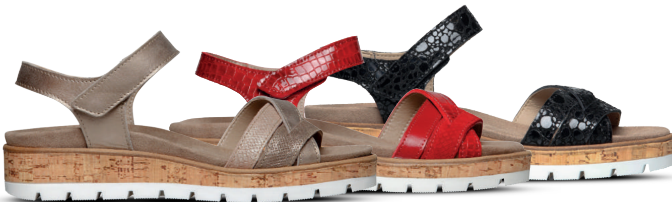
COMMON PAIRS Sandaal 37-43 Taupe - Rood - Zwart