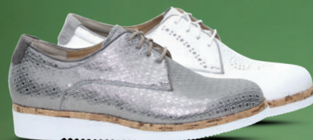
durea Veterschoen 38-43 Taupe - Wit