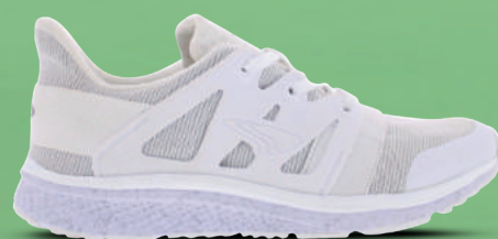
PIEDRO Sneaker 29-43 Wit - Rainbow colour