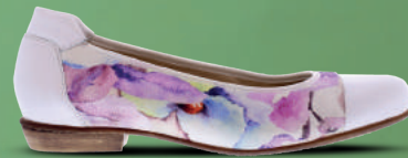
Verhulst Instapper 37-42 Wit met multi colour