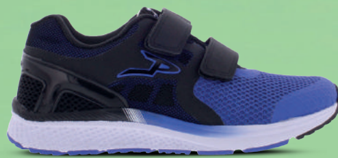
PIEDRO Kleefband 25-45 Kobalt - Oranje - Wit