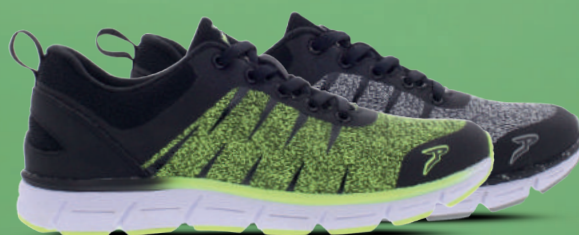
PIEDRO Sneaker 22-43 Geel/zwart - Grijs/zwart