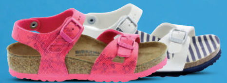
BIRKENSTOCK Sandaal 24-34 Roze - Wit Ook als watersandaal