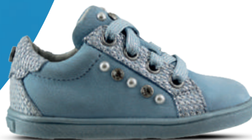
TWINS & TRACKSTYLE NO SIZE FITS ALL Veterschoen 20-26 Baby blauw - Roze