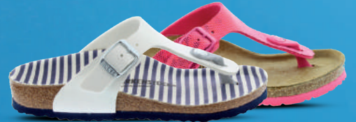
BIRKENSTOCK Slipper 30-39 Wit - Roze - Blauw Zwart - Bruin - Mocca