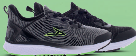
PIEDRO Sneaker 28-45 Grijs - Zwart - Olijf groen